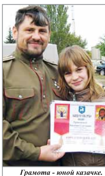
Грамота - юной казачке.