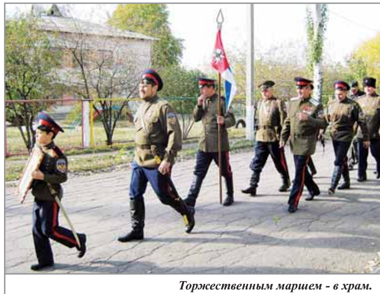
Торжественным маршем - в храм.