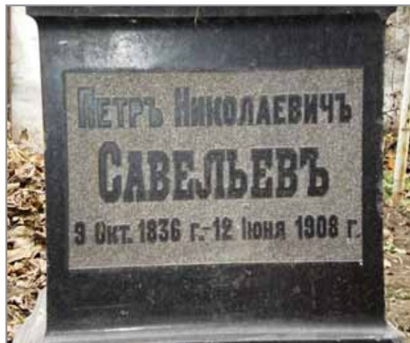
Надгробный памятник архитектору.

СПОРТ • СПОРТ • СПОРТ • СПОРТ • СПОРТ • СПОРТ • СПОРТ • СПОРТ • СПОРТ • СПОРТ