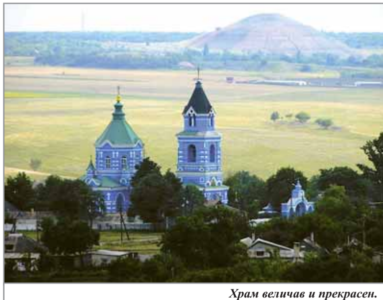
Храм величав и прекрасен.

Известно, что немалые средства на возведение храма выделила администрация Максимовского рудника. К 1914 году, как сказано в документах, храм посещало 988