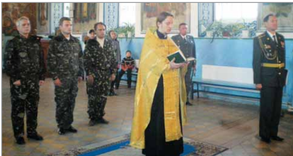
Идет очередное богослужение.