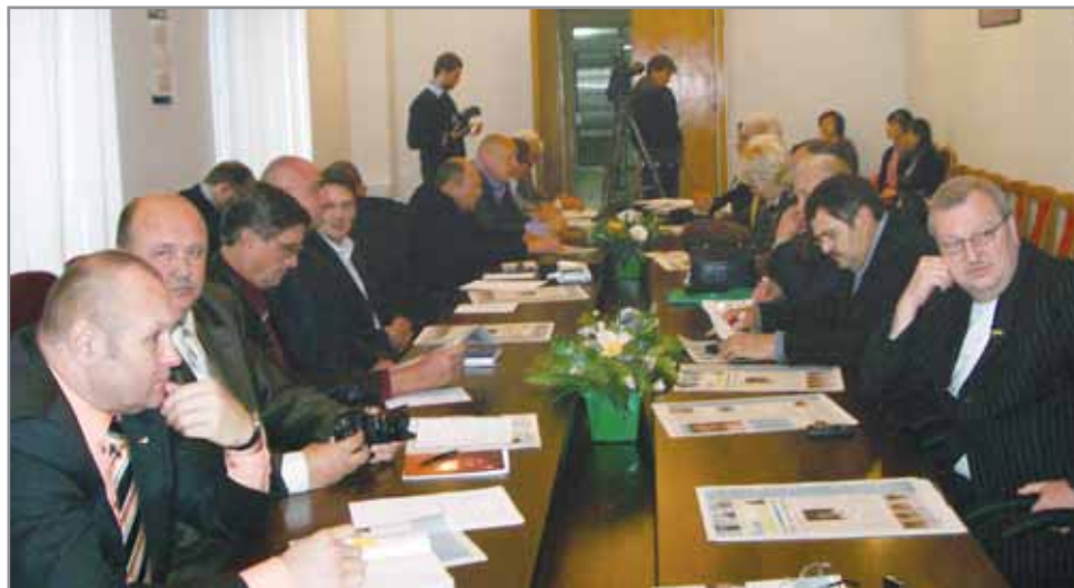
На заседании совета атаманов при председателе Донецкой областной государственной администрации.