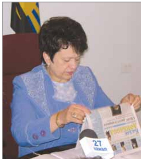
Заместитель губернатора Людмила ДАВЫДЕНКО.