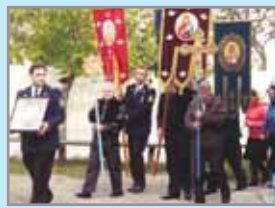
Фото-репортаж в номер