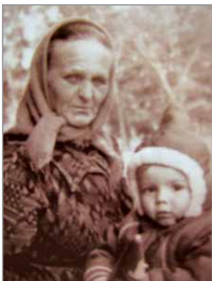
Бабушка со мной на руках

Бабушка была участником великих событий XX века: родилась в Первую мировую войну, пережила Октябрьскую революцию, голод 1932-1933 годов, Великую Отечественную войну. Уже в 14