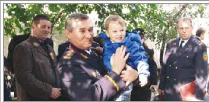
Фото на память после очередного круга казаков и встречи с жителями села Нижняя Крынка

- на базе списков казачьих формирований был составлен единый список личного состава всего департамента.