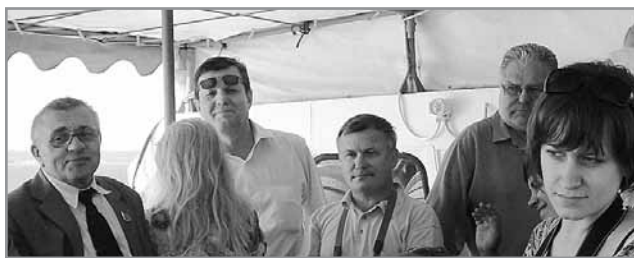
Группа журналистов во время прогулки на террасе