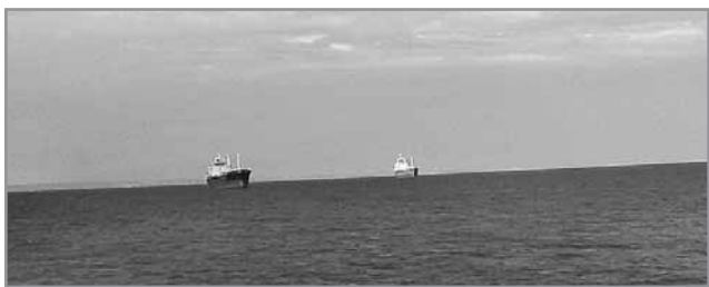
На просторах Азовского моря