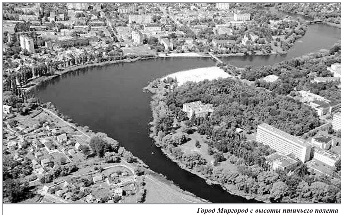
Город Миргород с высоты птичьего полета