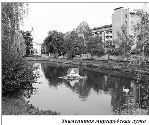
Знаменитая миргородская лужа