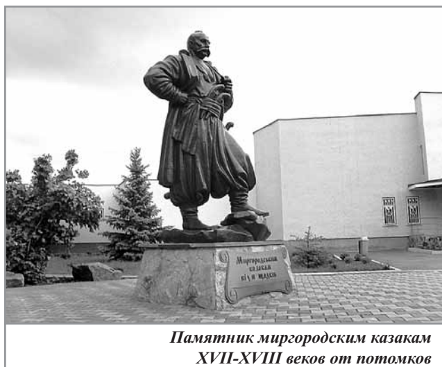
Памятник миргородским казакам XVII-XVIII веков от потомков