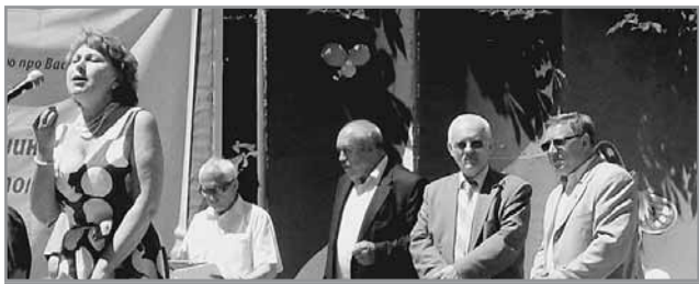
Торжества в городском саду

В этом году представители СМИ области на свой фестиваль по случаю профессионального праздника - Дня журналиста - собрались в Мариуполе. В городе у моря они провели смотр своих сил, поделились опытом, обсудили имеющиеся проблемы и, конечно же, пообщались с читателями.