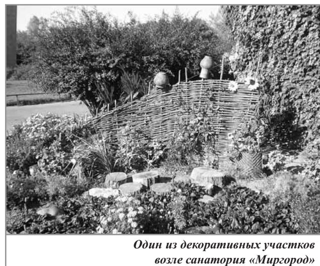
Один из декоративных участков возле санатория «Миргород»