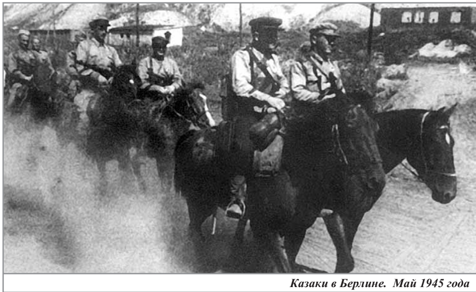
Казак в Берлине. Май 1945 года