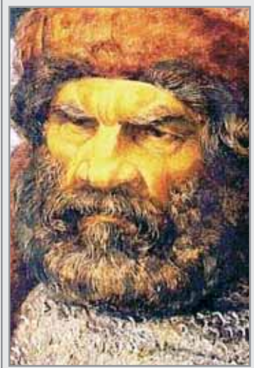
Ермак Тимофеевич - казачий атаман, завоеватель Сибири. Большинство исследователей считают его донским или волжским казаком, а согласно некоторым летописям он был выходцем из Центральной России

13 июня 1575 года отряд Ермака двинулся в поход. Сначала плыли по Каме, а потом по Чусовой до реки Серебрянки. Там, волоком, - до истоков реки Тагил, «на ту сторону Камня». На перевале казаки построили городок Кокуй, где зимовали