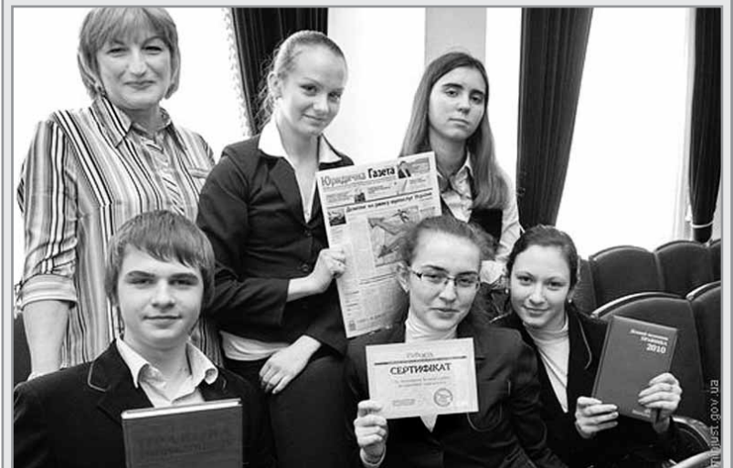
Вот они - знатоки права

Команда донецкого лицея для одаренных детей «Эрудит», ставшая победителем областного тура конкурса «Знатоки права», посвященного 300-й годовщине конституции Пилипа Орлика (об этом сообщалось в прошлом номере газеты), затем приняла участие во Всеукраинском правовом турнире, организованном Министерством юстиции Украины.