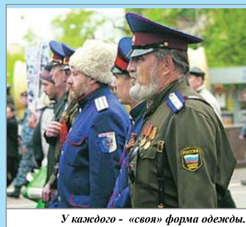
У каждого - «своя» форма одежды.

ются главному управлению казацких войск при Администрации президента РФ и несут службу по охране общественного порядка (некоторые вроде бывших добровольных народных дружин), но оружия не имеют. И альтернатива им - общественные организации, ратующие за свободу от центральной власти. Между ними идут довольно острые трения - «правильные казаки» критикуют нереестровцев за то, что они не служат, а зарабатывают деньги, «продавая» полковничьи и генеральские звания и самоучрежденные казацкие «псевдонаграды» высоким чиновникам на местах.