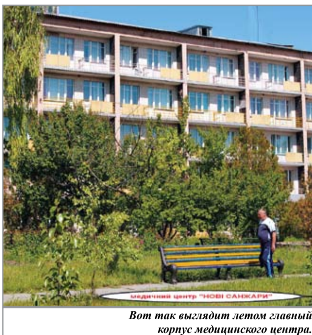
Вот так выглядит летом главный корпус медицинского центра.

Одним словом, тот, кому удалось оздоровиться в Новосанжарском медицинском центре, уже не ищет лучшего.