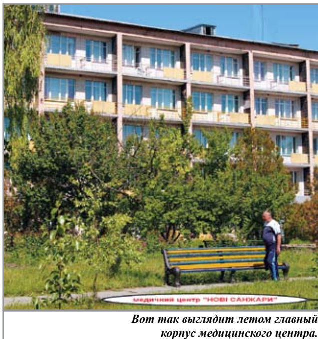
Вот так выглядит летом главный корпус медицинского центра.

Одним словом, тот, кому удалось оздоровиться в Новосанжарском медицинском центре, уже не ищет лучшего.