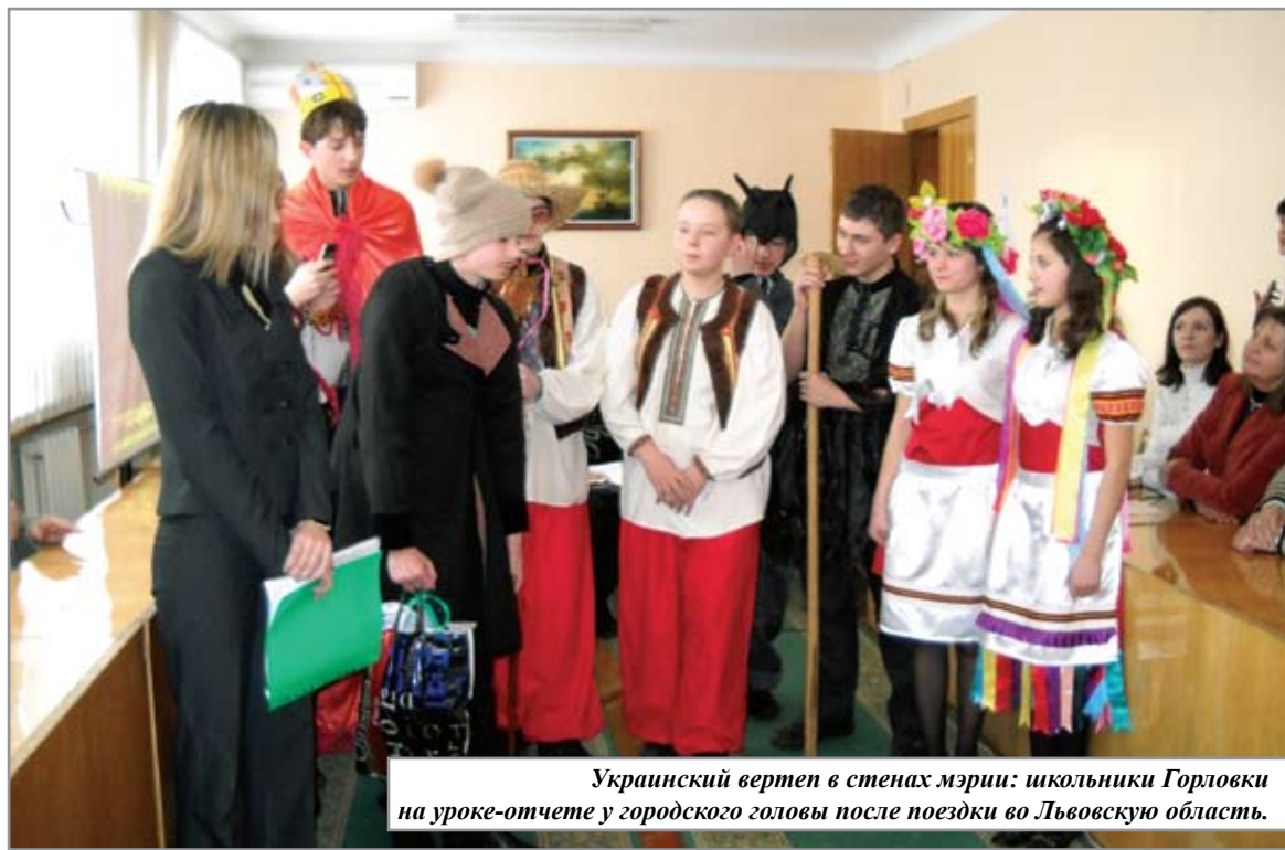
Украинский вертеп в стенах мэрии: школьники Горловки на уроке-отчете у городского головы после поездки во Львовскую область.

Николай КУРДАСОВ. Сборкор в Горловке, Артемовске и Дзержинске.