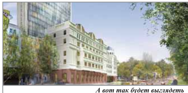
А вот так будет выглядеть гостиничный комплекс «Пушкинский»