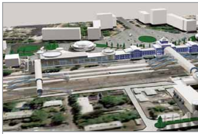
Таким будет ж/д вокзал Донецка после реконструкции.