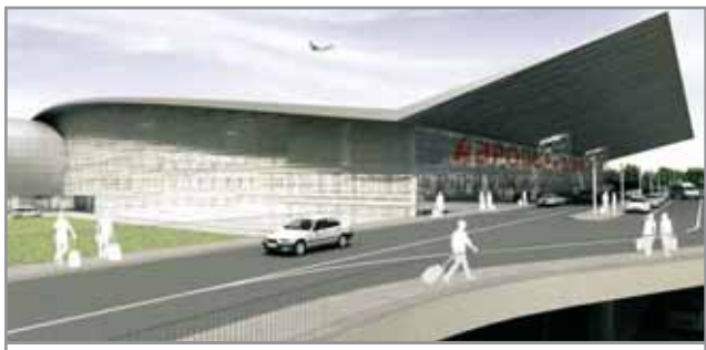
Эскизный проект нового терминала аэропорта Донецка.