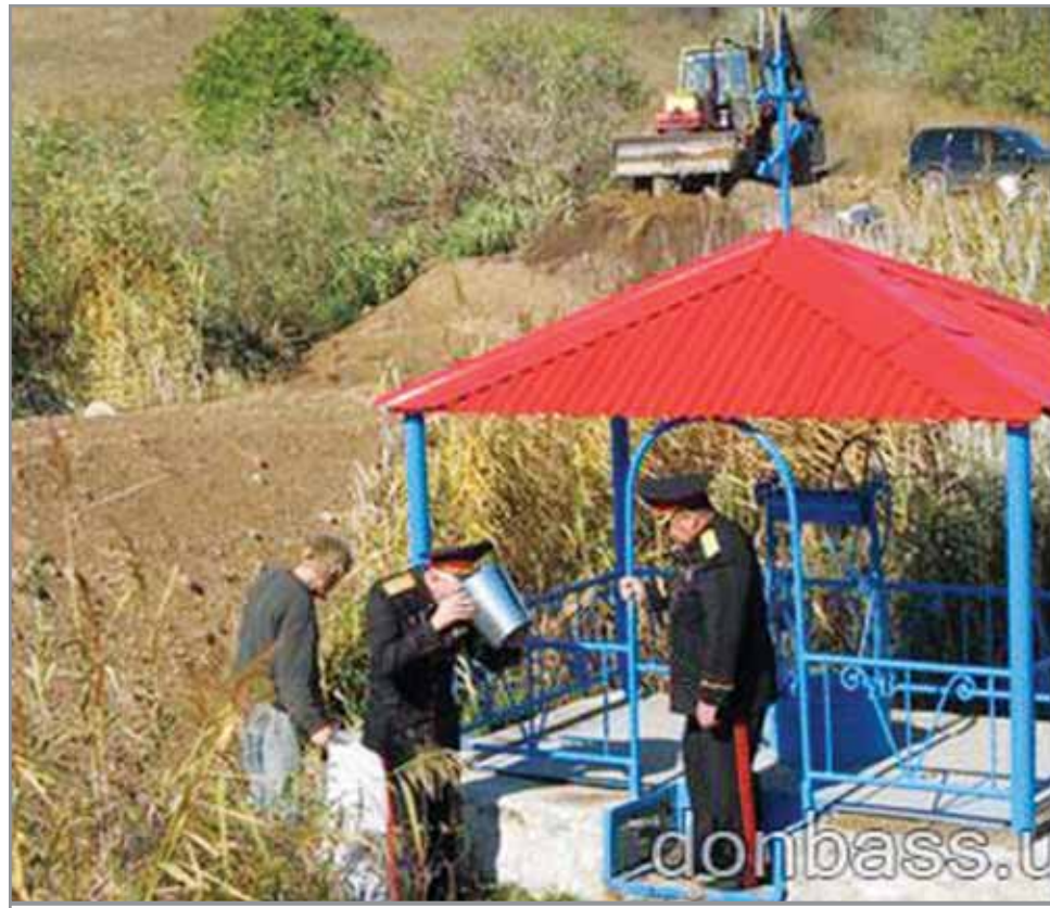
Эта дамба защитит от паводков криницу, которая возвращена к жизни казаками поселка Новотроицкое Волновахского района.

срубом, лихой народ пустых бутылок набросал». Чистые тебе галлюцинации, но ты же знаешь, что у нас водка и табак не в почете... Схватываюсь ни свет ни заря, еду проверить сон. А он, что называется, в руку. Судя по следам, гуляла здесь компания отморожков, везде мусор, кто-то даже обувь о сруб почистил, да и заилило криницу основательно летним паводком.